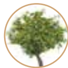
PIANTE DA FRUTTO

Prodotto a base di ortica ( Urtica spp. ), sostanza di base presente in natura, nota per le sue proprietà insetticide, acaricide e fungicide. Applicabile su diverse tipologie di piante (alberi da frutto, insalate, patata, floreali), agisce contro insetti quali afidi, tignole, carpocapsa, ragnetto rosso e contro funghi, quali alternaria, oidio, muffa, peronospora.